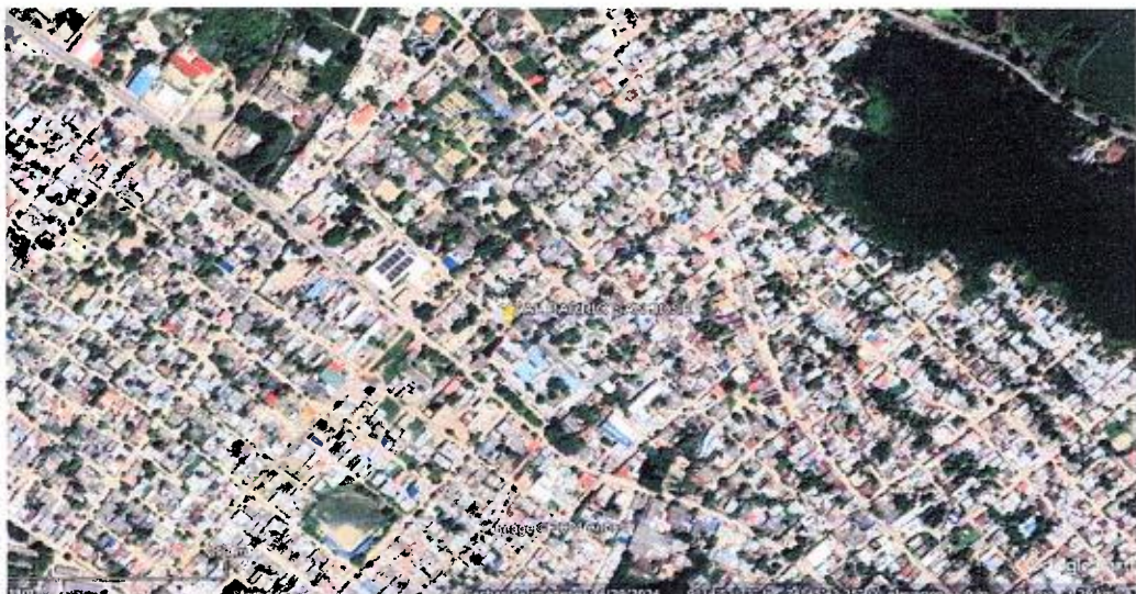
Imagen 1. Arboles establecidos en la solicitud de tala