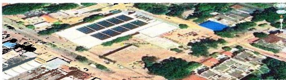
Imagen 1. Estación DISTRACON – Magangué