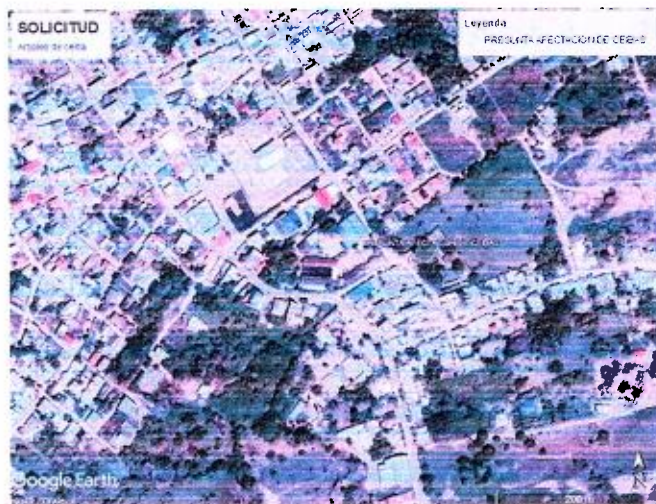
Imagen 1. Árboles de Ceiba– Santa Rosa