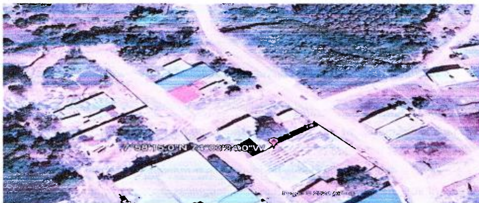
Imagen 1: Área solicitud de Instalaciones empresa Minerbol S.A.S.