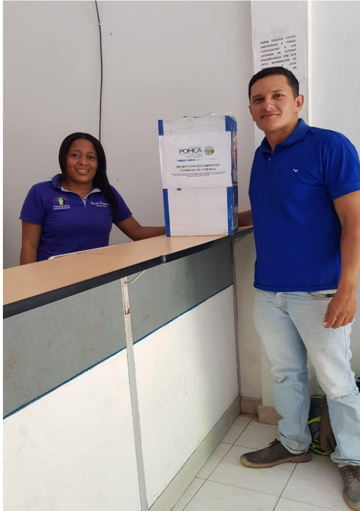
Ilustración 1. Apertura de Urnas en el Municipio de Simití Bolívar.