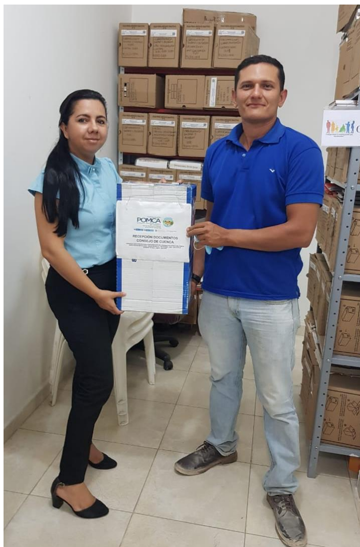
Ilustración 3. Apertura de Urnas en el Municipio de Santa Rosa del Sur Bolívar.