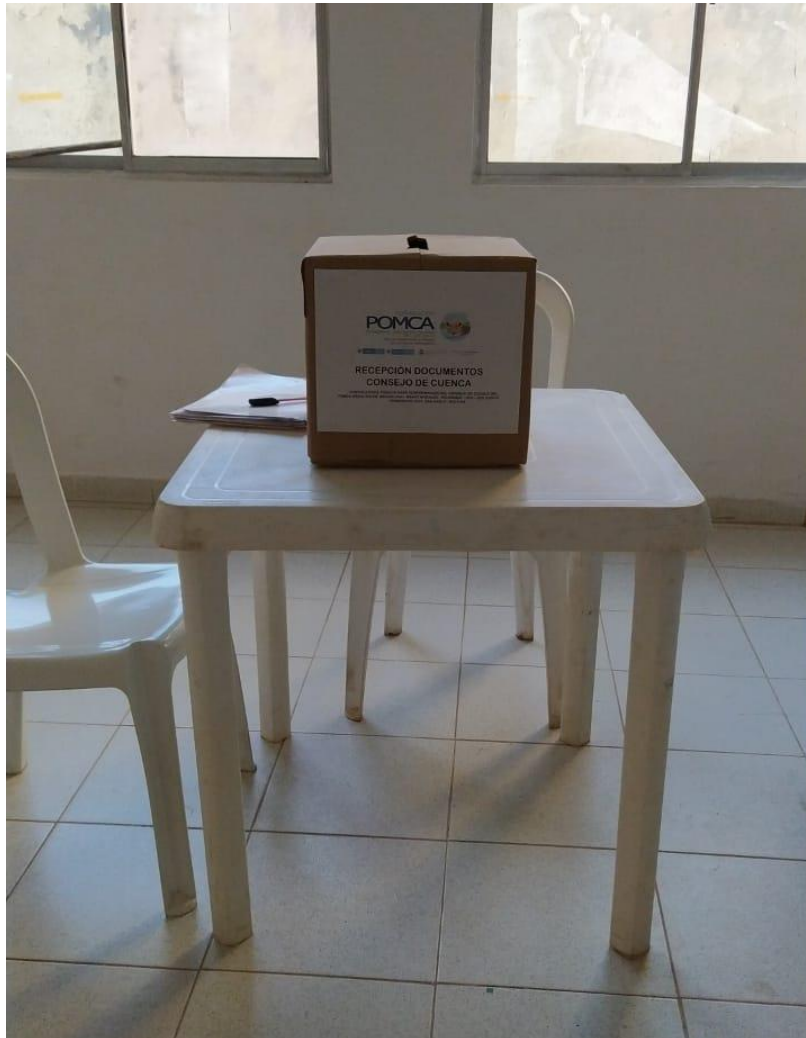
Ilustración 2. Apertura de Urnas en el Municipio de San Pablo Bolívar.